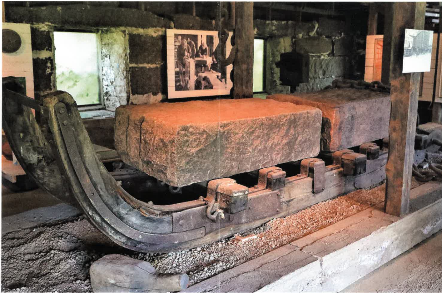
Kivityömuseon pysyväisnäyttelyssä on esillä mm. oikea kivireki.